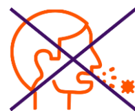
Hoesten en niezen in elleboog