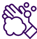
Goed handen wassen