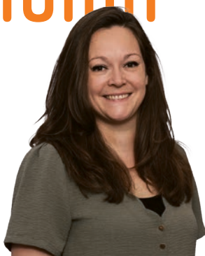
Tanita team Communicatie