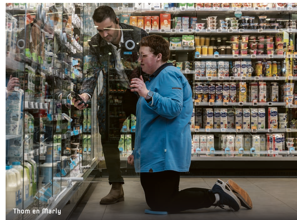
Thom en Marly